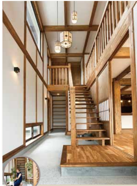
◆草花を楽しめる吹抜けになった洗い出しの玄関土間