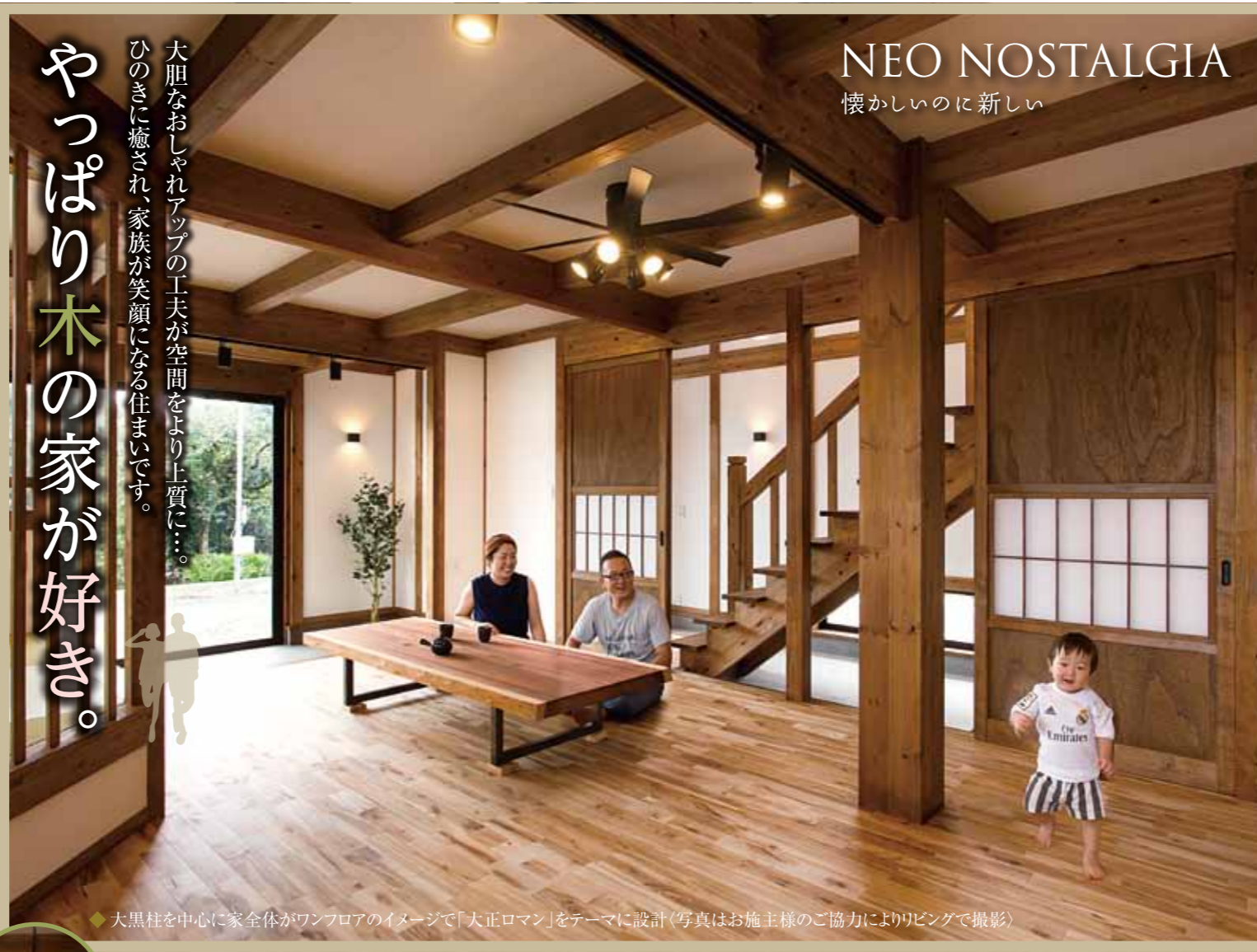
◆大黒柱を中心に家全体がワンフロアのイメージで「大正ロマン」をテーマに設計(写真はお施主様のご協力によりリビングで撮影)

大胆なおしゃれアップの工夫が空間をより上質に…。 ひのきに癒され、家族が笑顔になる住まいです。