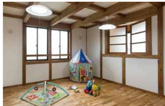
◆将来、区切って2部屋にできる子供部屋(2F)