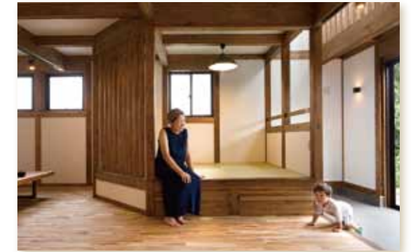
◆リビング土間と小上がりの畳コーナー