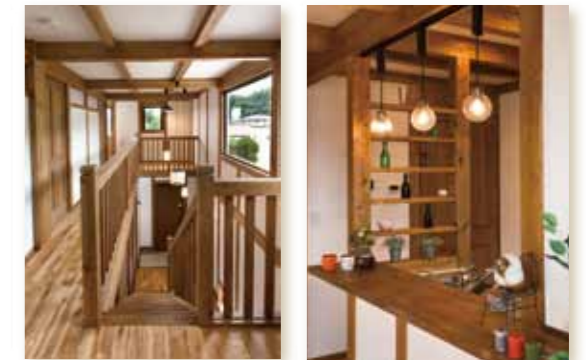
◆家全体に光と風を運ぶ吹抜け空間(2F) ◆センスの良い照明や飾り棚